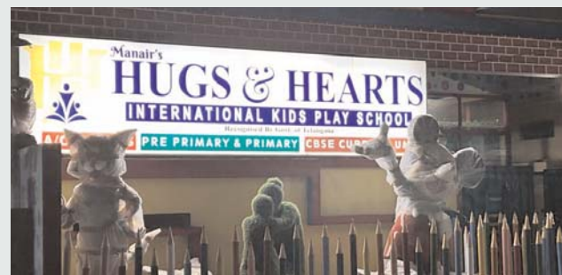
సీబీఎస్ఈ సిలబస్ అంటూ శ్రీ చైతన్య స్కూల్ ఏర్పాటు చేసిన ఫ్లేక్స్.. పర్మిషన్ లేకున్నా సీబీఎస్ఈ హైస్కూల్ అని మానేరు హాస్ అండ్ హార్ట్ ఫ్లేక్స్