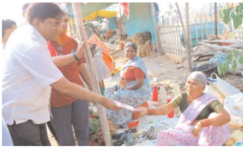
కాంగ్రెస్ నాలుగు నెలల పాలనపై ప్రజల్లో వ్యతిరేకత ఎన్నికల్లో ఓట్లు దండుకోవడానికే కొత్త నాటకాలు బీజేపీ, కాంగ్రెస్ ఒక్కటే కరీంనగర్లో అభ్యర్థిని ప్రకటించలేదు