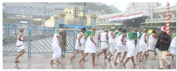
మారిపోయింది. మరోవైపు, కొండపై భారీ వర్షం కురిసినప్పటికీ, కింద తిరువతిలో వర్షం లేకపోవడం గమనార్హం.

తిరుమల : ఎపిల్ ఎండలు మండిపోతున్నాయి. ఎక్కడి చూసినా దాదాపు 45 డిగ్రీల ఉష్ణోగ్రతతో జనాలను తారెత్తిస్తున్నాయి. ఇప్పటికే ఎంతో మంది వడదెబ్బకు గురై ప్రాణాలు కోల్పోయారు. మరోవైపు కలియుగ దైవం శ్రీవేంకటేశ్వరస్వామి కొలువై ఉండే తిరుమలలో భారీ వర్షం కురిసింది. భారీ ఎండలతో కొన్ని రోజులుగా అల్లాడిపోతున్న భక్తులు ఒకసారిగా కురిసిన వర్షంతో ఉపశమనం పొందారు. ఉదయం నుంచి కూడా తిరుమలలో వాతావరణం కొంత చల్లగానే ఉంది. మధ్యాహ్నం సమయానికి వాతావరణం పూర్తిగా మారిపోయి అరగంట సేపు జోరు వాన కురిసింది. ఈ వర్షంతో తిరుమల చల్లగా