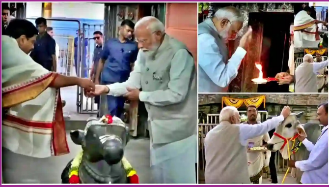
వేములవాడ రాజన్న సేవలో