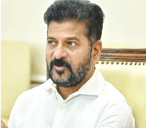
కానీ రాత్రి ఏడు గంటల వరకు ఈ సమావేశం నుంచి సస్పెండ్ చేసినట్లు తెలుస్తుంది.

మొదటి పేజీ తరువాయి హైదరాబాద్, మే, 18 : తెలంగాణ రాష్ట్ర కేబినెట్ సమావేశానికి ఎన్నికల సంఘం నుంచి అనుమతి రాలేదు. దీంతో కేబినెట్ సమావేశం వాయిదా పడింది. శనివారం సాయంత్రం సమావేశమై పలు కీలక నిర్ణయాలు తీసుకోవాలని మంత్రివర్గం భావించింది. ఇందుకు సంబంధించి అజెండాను కూడా సిద్ధం చేసింది. కానీ ఎన్నికల కోడ్ అమల్లో ఉండటంతో ఈ సమావేశం కోరింది. కానీ అనుమతి రాక పోవడంతో ముఖ్యమంత్రి రేవంత్ రెడ్డి, రాష్ట్ర మంత్రులు సవివాలయం నుంచి తిరిగి వెళ్లిపోయారు. ఈ సమావేశం వచ్చాక కేబినెట్ సమావేశం నిర్వహించాలని నిర్ణయించారు. సోమవారం లోగా ఈ సమావేశం రాకపోతే మంత్రులతో కలిసి ఢిల్లీకి వెళ్లి అనుమతి కోరాలని ముఖ్యమంత్రి నిర్ణయించారు. ఈ సమావేశం వచ్చినా అనుమతి రావచ్చునని మధ్యాహ్నం నుంచి మంత్రులు, అధికారులు సవివాలయంలోనే వేచి ఉన్నారు. ప్రభుత్వ ప్రధాన కార్యదర్శి పాటు అన్ని విభాగాల అధికారులు కేబినెట్ భేటీకి హాజరయ్యేందుకు కార్యాలయాలకు చేరుకున్నారు.