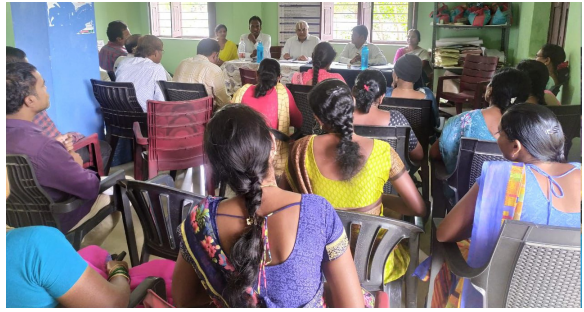
తెలంగాణ క్యాపిటల్ న్యూస్, గన్నేరుపరం: