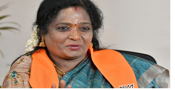
కోసం ఎందుకు ఒత్తిడి చేయలేకపోతున్నారో తనకు అర్థం కావడం లేదని తమిళిసై అన్నారు. రాష్ట్రంలో గంజాయి, మాదక ద్రవ్యాల వ్యాపారాలు జోరుగా జరుగుతున్నా డీఎంకే ప్రభుత్వం ఎలాంటి చర్యలు చేపట్టడం లేదని ఆమె ఆరోపించారు.

మొదటి పేజీ తరువాయి చెన్నై : రాష్ట్రంలో దశాబ్దాలుగా డీఎంకేకు వంతపాడుతుంటే కాంగ్రెస్ ఎలా అభివృద్ధి చెందగలదని, తెలంగాణా మాజీ గవర్నర్, సోత్ చెన్నై లోక్ సభ నియోజకవర్గం బీజేపీ అభ్యర్థి డాక్టర్ తమిళిసై సాందరరాజన్ ప్రశ్నించారు. ఏపార్టీ అయినా స్వశక్తితో ఎదగాలని, ఇతర పార్టీల దయాదాక్షిణ్యాల పై ఎదగకూడదని హితవు పలికారు. శనివారం ఆమె వేలూరు జిల్లా స్వర్ణాలయ సందర్శనకు వచ్చిన సందర్భంగా మీడియాతో మాట్లాడారు. కావేరి డెల్టా జిల్లాలకు 2.5 టీఎంసీల కావేరి జలాలు విడుదల చేయాలని కావేరి నిర్వాహక మండలి కర్ణాటక ప్రభుత్వానికి ఆదేశాలిచ్చినా ఆ రాష్ట్రంలోని కాంగ్రెస్ ప్రభుత్వం పట్టించుకోవడం లేదని, ఇండియా కూటమిలోనే డీఎంకే, కాంగ్రెస్ పార్టీలున్నాయని, అలాంటప్పుడు కర్ణాటకలోని కాంగ్రెస్ ప్రభుత్వంపై ముఖ్యమంత్రి స్టాలిన్ కావేరి జలాల