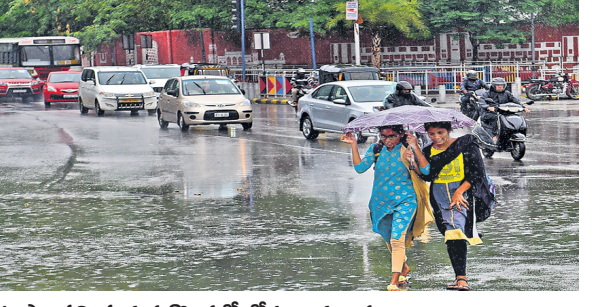
భూపాలపల్లి, హనుమకొండలో జోరు వానలు కురిశాయి. రాష్ట్రవ్యాప్తంగా 1.71 సెంటీమీటర్ల వర్షపాతం పడినట్లు వాతావరణ శాఖ వెల్లడించింది. రెండు రోజులుగా వర్షాలు కురుస్తుండటంతో తెలంగాణ వ్యాప్తంగా ఉష్ణోగ్రతలు భారీగా పడిపోయాయి. ఆదిలాబాద్ జిల్లాలో గరిష్ట ఉష్ణోగ్రత 37.8 డిగ్రీల సెల్సియస్ అయ్యింది. కనిష్ట ఉష్ణోగ్రత మెదకల్లో 21.3 డిగ్రీల లెజిస్టర్ అయింది. ఇదే వాతావరణం మరో రెండు మూడు రోజులు ఉంటుందని వాతావరణ శాఖ అంచనా వేస్తోంది.

మొదటి పేజీ తరువాయి హైదరాబాద్/విజయవాడ, మే 18 : ఉరుములు మెరుపులు, విడుగులతో కూడిన వర్షాలు వర్షం తాయి. గురు శుక్రవారం కూడా బాబట్ల, గుంటూరు, కృష్ణా, ప్రకాశం, సత్యసాయి, నంద్యాల, అన్నమయ్య, చిత్తూరు, ప్రకాశం జిల్లాల్లో 131 సెంటీమీటర్ల నుంచి 43 సెంటీమీటర్ల వరకు వర్షపాతం నమోదు అయింది. యర్రే రెండు రోజుల పాటు వర్షాలు ఉంటాయని వాతావరణ శాఖ చెబుతోంది. తేలికపాటి నుంచి మోస్తరు వర్షాలు వడ అవకాశం ఉందని వెల్లడించింది. మధ్యప్రదేశ్ కు ఆసుకొని ఉన్న సైక్లోనిక్ సర్క్యులేషన్, చక్రీస్ గడ్, తమిళాడు మధ్య ఉన్న మరో అవర్తనం కారణంగా తెలంగాణలో వాతావరణం చల్లబడింది. కొన్ని ప్రాంతాల్లో తేలిక పాటి వర్షాలు మిలకొని, ప్రాంతాల్లో కుండపోత వర్షాలు కురుస్తున్నాయి. ఎల్లో అల్పస్థితిలో వేసిన జిల్లాల గవర్నర్ జిల్లా, ములగులు, భద్రాద్రి కొత్తగూడెం, వరంగల్, ఖమ్మం, నల్గొండ, నూరుపేట, జూబిలీహిల్స్, భువనగిరి, రంగారెడ్డి, నాగర్ కర్నూల్, వనపర్తి శుక్రవారం వర్షాలు కురిసిన ప్రాంతాలు: నాగర్ కర్నూలు, జయశంకర్, సిద్దిపేట, ఆసిఫాబాద్, గద్వాల, కఠింనగర్,