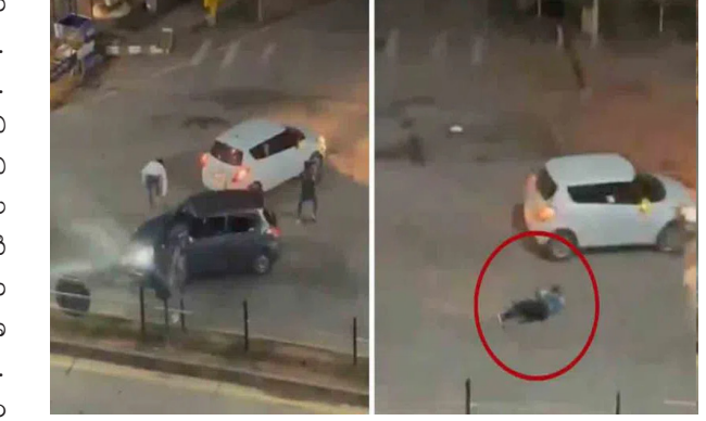
నిందితులను తర్వాత పట్టుకుంటామని పోలీస్ అధికారి తెలిపారు. మరోవైపు కార్లతో ఘర్షణకు సంబంధించిన వీడియో క్లిప్ సోషల్ మీడియాలో వైరల్ అయ్యింది.

బెంగళూరు: రెండు వర్గాల మధ్య గ్యాంగ్ వార్ జరిగింది. కార్లను వేగంగా నడిపి, వ్యక్తులను తొక్కించి హింసాత్మక ఘర్షణకు పాల్పడ్డారు. కార్ల నుంచి కిందకు దిగి దాడులు చేసుకుని బీభత్సం సృష్టించారు. ఈ వీడియో క్లిప్ సోషల్ మీడియాలో వైరల్ అయ్యింది. కర్ణాటకలోని ఉడిపి జిల్లాలో ఈ సంఘటన జరిగింది. ఈ నెల 18న కుంజిబెట్టలోని ఉడిపి-మణిపాల్ జాతీయ రహదారిపై ఒక గ్యాంగ్ లోని రెండు వర్గాల మధ్య హింసాత్మక ఘర్షణ జరిగింది. రెండు కార్లు ఒకదానికొకటి ఢీకొన్నాయి. ఆ తర్వాత కొంత మంది వ్యక్తులు కార్ల నుంచి బయటకు వచ్చారు. ప్రత్యర్థి మూలా సభ్యులపై దాడులు చేశారు. ఈ ఘర్షణ సందర్భంగా రివన్ లో వేగంగా వచ్చిన కారుతో ఒక వ్యక్తిని తొక్కారు. అలాగే మరికొందరిని కారుతో ఢీకొట్టారు. కాగా, కార్లతో బీభత్సం సృష్టించిన ఈ ఘర్షణపై పోలీసులు స్పందించారు. ఈ కేసులో ఇద్దరు వ్యక్తులను అరెస్టు చేశారు. ఒక స్పెషల్ కారు, రెండు ద్విచక్ర వాహనాలు, కత్తులు, ఆయుధాలను స్వాధీనం చేసుకున్నారు. పరాచీలో ఉన్న ఇతర