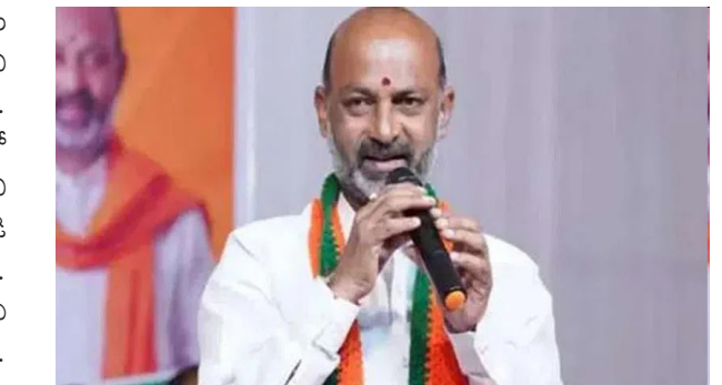
సంజయ్ తెలిపారు. ప్రభుత్వాన్ని పదగొట్టే అవకాశాన్ని కాంగ్రెస్ నేతలు ఇంకొకరికి ఇవ్వరని ఎద్దేవా చేశారు. పార్లమెంటు ఎన్నికల ఫలితాల తర్వాత కాంగ్రెస్ నేతలు రోడ్లపై తిరిగి పరిస్థితి ఉండదని విమర్శించారు.

రాష్ట్రంలోని కాంగ్రెస్ ప్రభుత్వంపై కరీంనగర్ బీజేపీ ఎంపీ బండి సంజయ్ విరుచుకుపడ్డారు. రైస్ మిల్లర్లతో కాంగ్రెస్ నేతల కుమ్మక్కయారని అన్నారు. వేల కోట్లు దోచుకుని ఢిల్లీకి పంపుతున్నారని ఆరోపించారు. నల్గొండ జిల్లా బీజేపీ కార్యాలయంలో శనివారం ఆయన మీడియాతో మాట్లాడారు. పౌరసరఫరా శాఖలో అతిపెద్ద కుంభకోణం జరిగిందని అన్నారు. రైస్ మిల్లర్లతో కాంగ్రెస్ నాయకులు కుమ్మక్కయారని బండి సంజయ్ అన్నారు. ఉత్తమ కుమార్ రెడ్డిపై తనకు నమ్మకం ఉందని.. కానీ ఆయన కత్తి తీయడం లేదన్నారు. రైస్ మిల్లర్ల నుంచి ఏ నాయకుడికి ఎంత ముద్దీందో విచారణ జరిపించాలని డిమాండ్ చేశారు. రాష్ట్ర ప్రభుత్వానికి చిత్తశుద్ధి ఉంటే ఆ శాఖలో జరిగిన అక్రమాలు, అవినీతిపై సిట్టింగ్ జడ్జిత్ విచారణ జరపాలని అన్నారు. పౌరసరఫరాల శాఖ నష్టాల్లో ఎందుకు ఉందో చెప్పాలని ప్రశ్నించారు. రాష్ట్రంలోని కాంగ్రెస్ ప్రభుత్వాన్ని పదగొట్టే ప్రయత్నాలు బీజేపీ చేయదని బండి