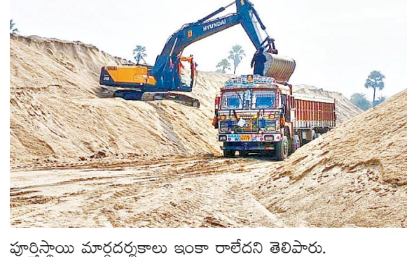
పూర్తిస్థాయి మార్గదర్శకాలు ఇంకా రాలేదని తెలిపారు.

పెద్దపల్లి, ఉమ్మడి కరీంనగర్ జిల్లాలోని మానేరు నది పరీవాహక ప్రాంతాల్లో పర్యావరణ అనుమతి (ఈసీ) లేకుండా నిబంధనలకు విరుద్ధంగా జరిగిన ఇసుక తవ్వకాలపై జాతీయ హరిత క్రాంతి బలగా (ఎన్టీకొరడా) కొరడా రుబిపించింది. ఎన్టీకొరడా సౌత్ బెంచ్ ఇచ్చిన తీర్పు ప్రకారం మానేరు నదిలో చెక్ డ్యామా నిర్మాణం కోసం ఇసుక ఫూడికతీత పనులు చేరేట తవ్వకాలు జరిపేయకుండా అనుమతి ఇవ్వనీ నీటిపారుదల, భూగర్భ గనుల శాఖలకు రూ. 25 కోట్ల జరిమానా విధించింది. ఈ జరిమానాను మూడు నెలల్లోగా గోదావరి నది యాజమాన్య బోర్డుకు చెల్లించాలని ఆదేశించింది. మానేరులో ఇసుక తవ్వకాలను నిలిపివేసేందుకు అవసరమైన చర్యలు తీసుకోవాలని రాష్ట్ర ప్రభుత్వ ముఖ్య కార్యదర్శిని ఆదేశించింది. ఈ విషయమై భూగర్భ, గనులశాఖ పెద్దపల్లి జిల్లా అధికారి శ్రీనివాసతో 'ఈనాడు' మాట్లాడగా ఎన్టీకొరడా ఉత్తర్వులిచ్చింది. వాస్తవమేనని అయితే