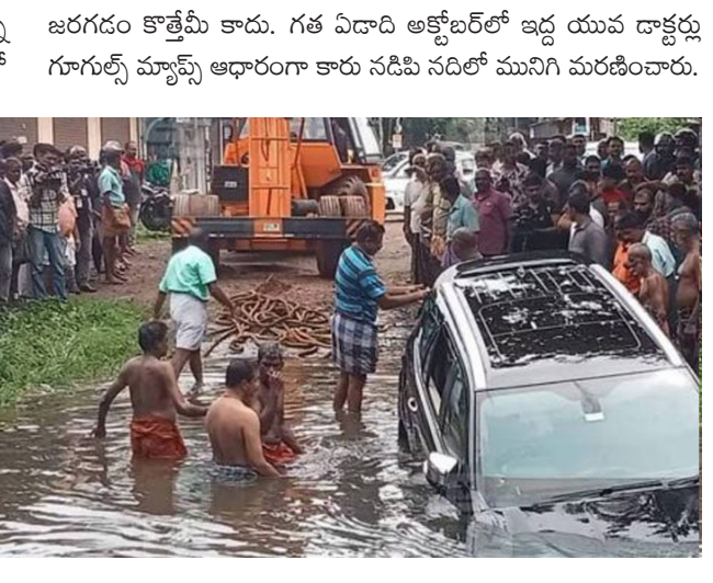
కాగా..వర్షాకాలంలో బెక్కాలజీని సమ్ముకుని ప్రయాణించవద్దని కేరళ పోలీసులు ప్రజలను హెచ్చరించారు.

కొట్టాయం: గూగుల్ మ్యాప్స్ ను సమ్ముకుని ప్రయాణిస్తున్న హైదరాబాద్ కు చెందిన ఒక పర్యాటకుల బృందం వాగులో కొట్టుకుపోయింది. శుక్రవారం రాత్రి జరిగిన ఈ ఘటనలో బృందానికి చెందిన నలుగురు పర్యాటకులను కేరళ పోలీసులు కాపాడారు. దక్షిణ కేరళలోని కొట్టాయం జిల్లాలోని కురుప్పన్ తరా సమీపంలో ఈ ఘటన జరిగింది. ఒక మహిళతోసహా నలుగురు సభ్యుల బృందం కారులో అలప్పుళ వెళ్తుండే సమయంలో కారు పొంగి నీరు రోడ్డుపై ప్రవహిస్తుండడంతో వారు ప్రవాహంలోనుంచే ముందుకు సాగారు. అయితే ఆ ప్రాంతంలో వారికి పరిచయం లేకపోవడంతో గూగుల్ మ్యాప్స్ ఆధారంగా ముందుకు వెళ్లేందుకు ప్రయత్నించగా వారి కారు వాగులోకి వెళ్లిపోయింది. సమీపంలోనే ఉన్న గస్తీ పోలీసులు స్థానకుల సహాయంతో వారిని వాగులో కొట్టుకుపోతున్న వారిని రక్షించారు. అయితే వారి కారు మాత్రం వాగులో పూర్తిగా మునిగిపోయింది. కారును బయటకు తీసుకువచ్చేందుకు ప్రయత్నిస్తున్నామని కడతురుతి పోలీసు స్టేషన్ అధికారి ఒకరు తెలిపారు. కేరళలో ఇటువంటి ఘటనలు