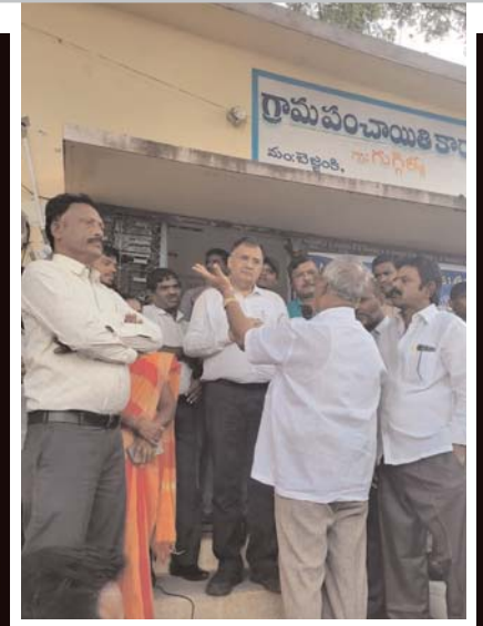
(తెలంగాణ క్యాపిటల్ న్యూస్, సిద్దిపేట/బెజ్జంకి)

పచ్చని పల్లెల్లో ఇథనాల్ ప్లాంటు చిచ్చురేపింది. నిన్నామొన్నటి వరకు రెండు పంటలు పండించుకుంటూ ఆనందంగా ఉన్న రైతుల జీవితాలను ఇథనాల్ చిన్నాబిన్నం చేసింది. పెందలాడే నిద్రలేపగానే పాలంబాట పట్టి సాగు పనుల్లో బిజీగా ఉండాల్సిన రైతులు.. తమ పనులు మానుకొని రోడ్లకొల్లిన పరిస్థితి వచ్చింది. జానపదాల పాటలతో పచ్చని పాలాల్లో సాగు పనులు చేసుకోవాల్సిన అన్నదాతలు.. 'మా గ్రామమే ముద్దు.. ఇథనాల్ ఫ్యాక్టరీ వద్దు' వద్దు అని నినదించాల్సిన దుస్థితి. మా గ్రామాల్లో ఫ్యాక్టరీ పెట్టిన వద్దు మొర్రో అని మొత్తుకుంటున్నా.. గ్రామ ప్రజలకు సమాచారం లేకున్నా.. ప్రాజెక్టు యాజమాన్యం మాత్రం తగ్గడం లేదు. ప్రాజెక్టు నిర్మాణంతో పచ్చని పాలాలు కాస్త బీడు భూములుగా మారుతాయని రైతులు ఆందోళన వ్యక్తం చేస్తున్నారు. ఈ సమస్య కేవలం ఒక్క గ్రామానిదే కాదు.. మూడు గ్రామాలకు సంబంధించినది కావడంతో రైతులు భారీ ఎత్తున ఆందోళనలు చేస్తూ వస్తున్నారు. ఇప్పటికే నిర్మాణ పనులను అడ్డుకున్నారు. విచారణకు వచ్చిన అధికారులనూ నిలబీశారు. రోజుల తరబడి రిలే డీక్షలు చేపట్టారు. పస్తులున్నారు.. నిద్రపోరాలు మానుకున్నారు.. అయినా వీరి పట్ల అటు అధికార యంత్రాంగానికి కానీ.. ఇటు ఫ్యాక్టరీ యాజమాన్యానికి కానీ కనికరం కలగడం లేదు. ప్రశాంతమైన పల్లెల్లో అలజడి రేపి.. భయాందోళనలకు గురిచేస్తున్న ఇథనాల్ కంపెనీపై 'తెలంగాణ క్యాపిటల్' ప్రత్యేక కథనం.