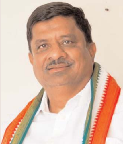
ప్రభావం చూపని అభ్యర్థి

పదేళ్ల తరువాత రాష్ట్రంలో కాంగ్రెస్ పార్టీ అధికారంలోకి వచ్చింది. ఎట్టకేలకు పార్టీ దశాబ్ద కల నెరవేరింది. కాంగ్రెస్ వేన్తో రాష్ట్రంలో బీఆర్ఎస్ పార్టీ తుడిచిపెట్టుకుపోయింది. ఇటు.. ఉమ్మడి కరీంనగర్ జిల్లాలోనూ ఆ పార్టీకి చెప్పుకోదగిన సీట్లే వచ్చాయి. ఉమ్మడి జిల్లాలో మొత్తంగా 13 సీట్లకు గాను 8 సీట్లలో జయకేతనం ఎగరవేసింది. జిల్లాలో ఇంతటి పాజిటివిటీ ఉన్నప్పటికీ కాంగ్రెస్ పార్టీ పార్లమెంట్ ఎన్నికల్లో ఎందుకు ఓడిపోయిందనే ప్రశ్న అందరిలోనూ తొలుస్తోంది. అటు పార్టీలో.. ఇటు ప్రజల్లోనూ దానికి సమాధానం దొరకడం లేదు. అయితే.. పార్టీ ఓడదానికి ప్రధానం కారణం అభ్యర్థినే అంటూ గుసగుసలు మాత్రం నడుస్తున్నాయి. ఎవరికీ పరిచయం లేని వ్యక్తిని నిలబెట్టడం వల్లే ఈ రోజు ఈ ఫలితం చూడాల్సి వచ్చిందనే విమర్శలు కార్యకర్తల వినిపిస్తున్నాయి. మొదటి నుంచి ఈ స్థానాన్ని కాంగ్రెస్ పార్టీ ఖాతాలో వేసేందుకు ఇన్చార్జ్ మంత్రి పొన్నం ప్రభాకర్ పగలు, రాత్రిపగళ్లు కష్టపడినా అభ్యర్థి అలసత్వం వల్లే పార్టీ ఓడిపోయినట్లుగా టాక్ నడుస్తోంది. ఆకట్టుకోలేని ప్రసంగం.. పట్టించుకోలేని తత్వం పార్టీకి మైనస్ అయిందని తెలుస్తోంది.