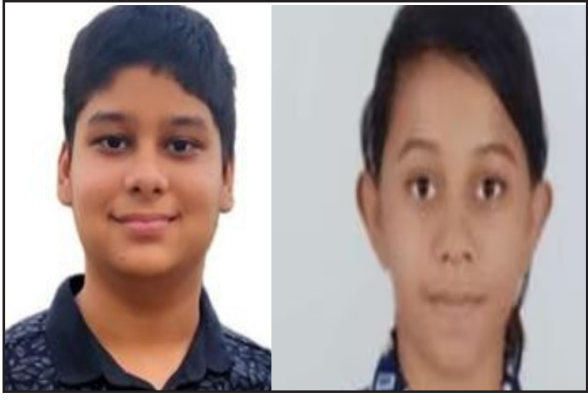
త్వర్ణులైన వారు ఐఐఐటిల్లో బి.టెక్ సీట్లకు పోటీ పడేందుకు అవకాశం ఉంటుంది.