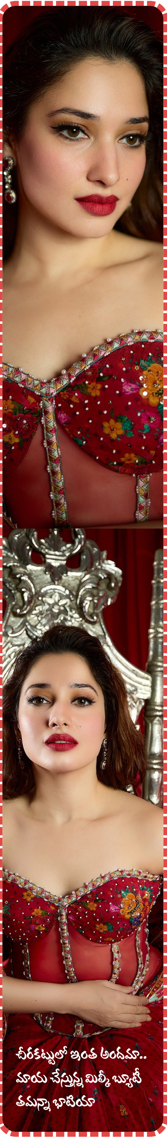
నీరకట్టులో ఇంత అందమా.. మాయ చేస్తున్న మిల్కీ బ్యూటీ తమ్మన్నా భాషియా

లాంటివి చేస్తూ ఉంటాడు. మరి ఇలాంటి క్రమంలోనే తన కూతురు అయిన సితార కూడా ప్రస్తుతం కొన్ని జ్యూవెలరీ కంపెనీలకు బ్రాండ్ అంబాసిడర్ గా కొనసాగుతుంది. కాబట్టి తను కూడా తన రెమ్యూనరేషన్ లో కొంత భాగాన్ని పేద విద్యార్థులకు సహాయం చేస్తుందనే విషయం మనలో చాలా మందికి తెలియదు.