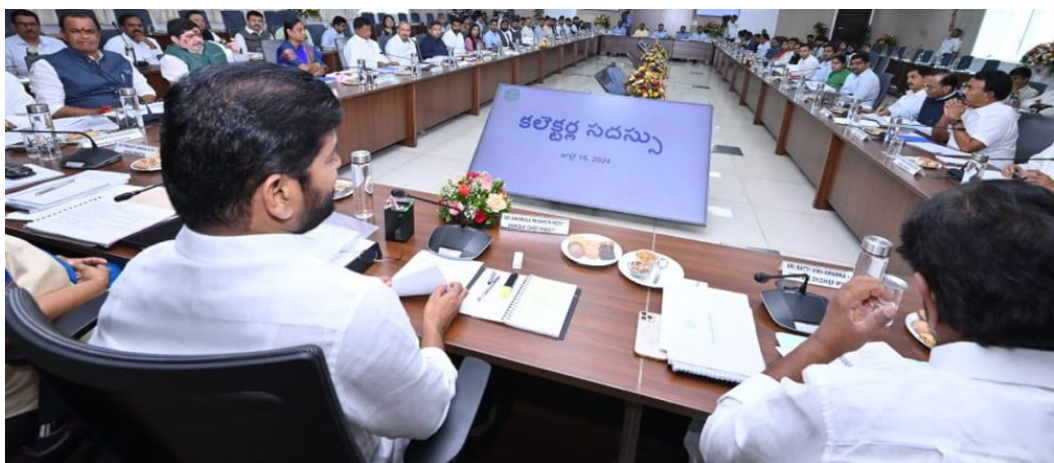
అభిప్రాయాలను వరిగణనలోకి తీసుకోవాలన్నారు. వారి అభిప్రాయాల మేరకు సమగ్ర చట్టం తేవాలన్నారు. అవసరమైతే అసెంబ్లీలో ధరణిపై చర్చ చేపడదామన్నారు. సమావేశంలో కేబినెట్ నబ్ కమిటీ చైర్మన్ దామోదర రాజనర్సింహ, మంత్రులు శ్రీధర్ బాబు, పొన్నం ప్రభాకర్ పాల్గొన్నారు.