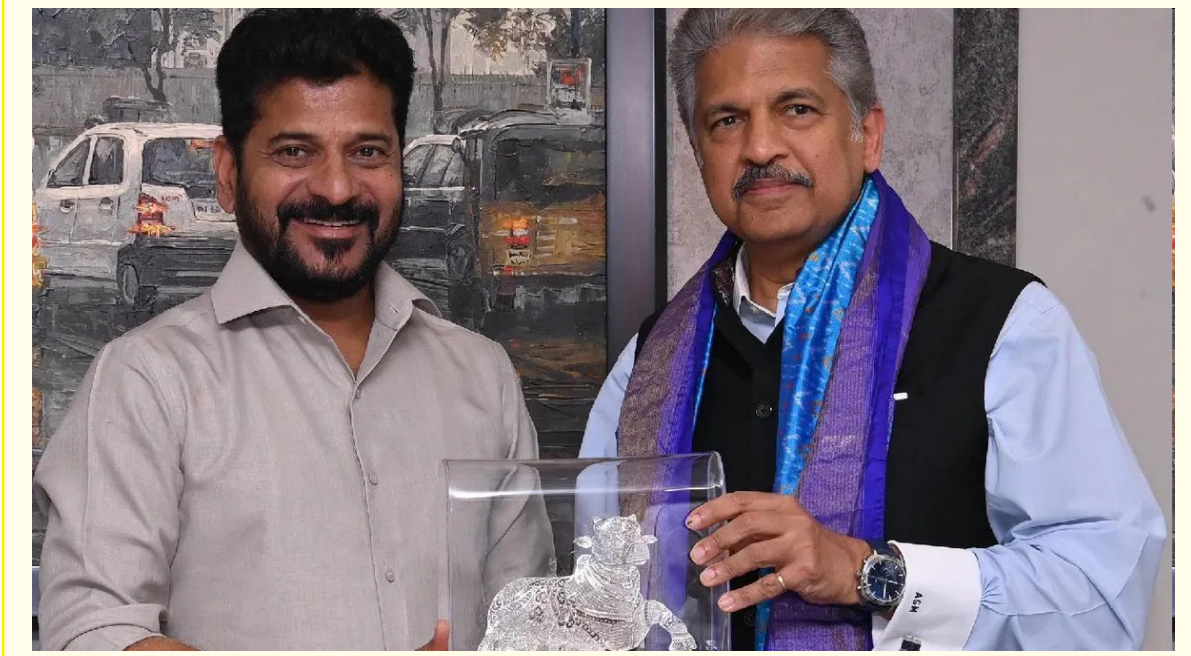
హైదరాబాద్ : ముచ్చైర్లలో నిర్వహించే స్కీల్ వర్కీటీ చైర్మన్ గా ప్రముఖ బిజినెస్ మెన్ ఆనంద్ మహేంద్రను నియమిస్తున్నట్లు సీఎం రేవంత్ రెడ్డి ప్రకటించారు. అమెరికా టూల్ లో ఉన్న సీఎం ఈ మేరకు ప్రకటన చేశారు. కాగా, ఈ నెల ఒకటి తేదీ ముచ్చైర్లలో స్కీల్ వర్కీటీ నిర్వహించే రేవంత్ మంత్రులతో కలిసి శంకుస్థాపన చేశారు. ఇది గడిచిన మరోరోజే సీఎం రేవంత్ రెడ్డిని ఆనంద్ మహేంద్ర ముఖ్యపూర్వకంగా కలిశారు. ఇక ఆ అమెరికా పర్వతంలో ఉన్న రేవంత్ ఆ వర్కీటీకి ఆనంద్ మహేంద్ర పేరును చైర్మన్ గా ప్రకటిస్తూ ఉత్తర్యలు జారీ చేశారు.