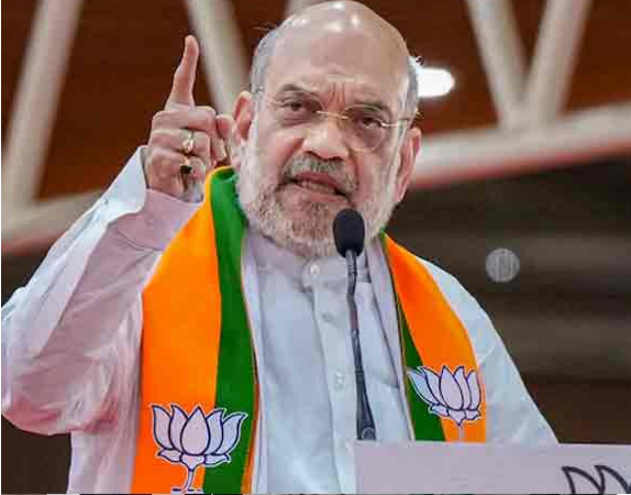
కూటమికి దక్కిన సీట్ల కన్నా బిజెపికి ఎక్కువ స్థానాలు వచ్చాయని, దేశంలో అనిశ్చితతను సృష్టించే యత్నాల్లో భాగంగానే ప్రతిపక్షాలు ఈ విధంగా తప్పుడు మాటలకు దిగుతారని విమర్శించారు.

న్యూఢిల్లీ: ఇప్పుడే కాదు 2029లో కూడా కేంద్రంలో అధికారం ఎన్డిఎదే అని కేంద్ర హోం మంత్రి అమిత్ షా స్పష్టం చేశారు. ప్రతిపక్షాలు ఈ విషయాన్ని రాసిపెట్టుకోవాలని, 2029లో కేంద్రంలో ఉండేది బిజెపి సారథ్యపు కూటమి ప్రభుత్వమే అన్నారు. స్థానికంగా మణిమజ్రా నిరంతర నీటి సరఫరా పథకానికి ఆదివారం ఆయన ప్రారంభోత్సవం జరిపారు. ఆ తరువాత విలేజ్ కరులతో మాట్లాడారు. కేంద్రంలో ఎన్డిఎ ప్రభుత్వ బలం లేదని, ఎప్పుడైనా కేంద్రంలోనిసర్కారు కూలుతుందని ఇండియా కూటమి నేతలు చెప్పడాన్ని అమిత్ షా తిప్పికొట్టారు. ఈ పర్యాయం తుదివరకూ ఉండటమే కాకుండా, తరువాతి ఎన్నికల్లో కూడా తమదే గెలుపు అని అమిత్ షా స్పష్టం చేశారు. విపక్షాలు ఇష్టం వచ్చినట్లు మాట్లాడుకోవచ్చు. అయితే దీనిని తాము వణించుకునేది లేదని, కేంద్రంలో తిరిగి నెలకొనేది తమ ప్రభుత్వమే, ప్రధానిగా తిరిగి వచ్చేది మోడీనే అని కేంద్రంలో నెంబరు టూగా చలామణిలో ఉన్న అమిత్ షా ఢీమా వ్యక్తం చేశారు. ప్రతిపక్షాలకు ఈసారి కొద్దిగా ఎక్కువ సీట్లు రాగానే తమకు తాము ఎన్నికల్లో గెలిచామనే భ్రమలో పడ్డారని షా తెలిపారు. మొత్తం ఇండియా