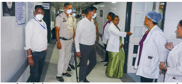
సూర్యాపేట: ధీల్లిలోని ఎయిమ్స్, సఫర్జం కింద 50 ప్రభుత్వ ప్రైవేట్ ఆస్పత్రులతోపాటు ఒక మాల్ కలవారం ఈ మొత్తం ద్వారా బాంబు బెదిరింపులు వచ్చాయి.

ధీల్లి పైఠాన్ల ఢిల్లీ అధికారి చెప్పారు. అగ్నిమాపక వాహనాలు, బాంబు తనిఖీ బృందాలు, పోలీసులు ఆయా ప్రాంతాలకు వెళ్లి తనిఖీ చేపట్టారని అయితే ఇంతవరకు ఎలాంటి అనుమానాస్పదమైనవి కనిపించలేదని అధికారులు చెప్పారు.