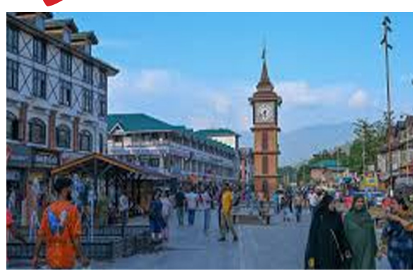
ప్రాంతంలోని సీట్లు ఇందర్వాలీ, కిష్టవార్, పార్దర్ నాగ్గేని, భదర్నాగ్, దోడా, దోడా పశ్చిమం, రాంబన్, బనిహాల్.

శ్రీనగర్ : జమ్మూ కాశ్మీర్లో మూడు దశల అసెంబ్లీ ఎన్నికల్లో మొదటి దశ కోసం ఎన్నికల కమిషన్ మంగళవారం నోటిఫికేషన్ జారీ చేసింది.