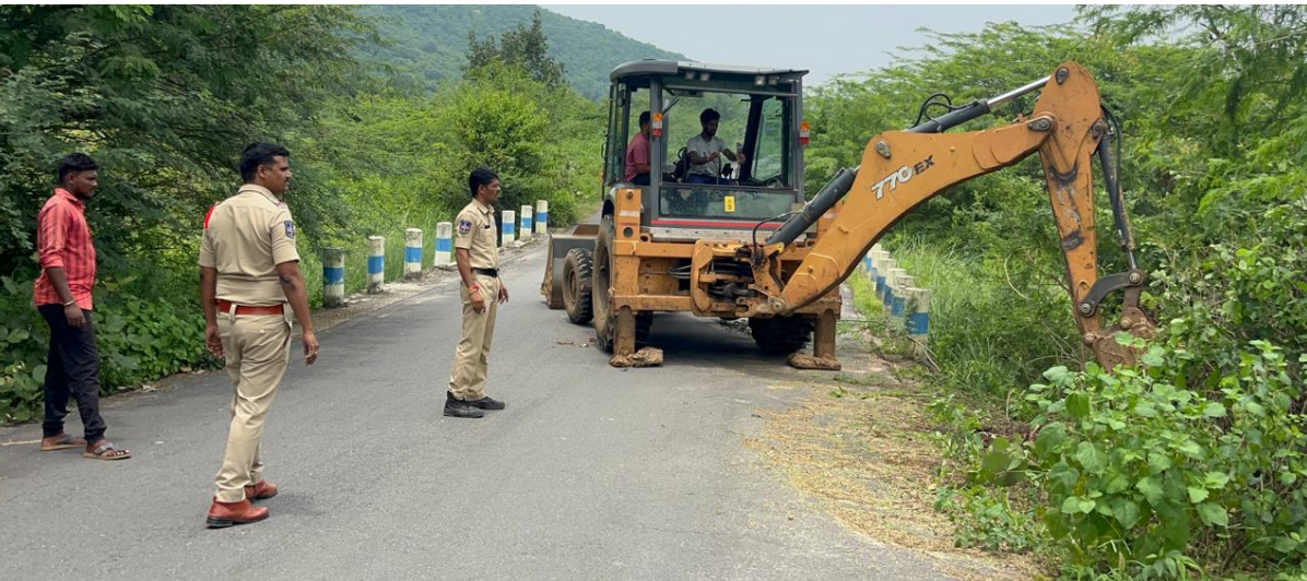
తెలంగాణ క్యాపిటల్ న్యూస్ ఇల్లంతకుంట: ఇల్లంతకుంట పోలీస్ శాఖ ఆధ్వర్యంలో జేసీబీ సహాయంతో ఇల్లంతకుంట నుండి సిరిసిల్ల కి పోయే మార్గం గుండా రోడ్డు మీద కి సర్కార్ తుమ్మి చేట్లు మరియు పిచ్చి మొక్కలు రోడ్డు కు అడ్డంగా వచ్చిన చెట్లను తొలగించి వాహనాదారులకు ఇబ్బంది లేకుండా చేసిన పోలీస్ శాఖను ప్రజలు అభినందించారు పోలీస్ శాఖను చూసి అయినా నాయకులు మారుతాలో లేదో చూడాలని అభిప్రాయపడ్డారు