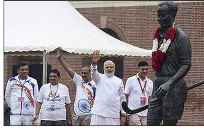
కేంద్ర ప్రభుత్వం క్రీడలకు మద్దతుగా నిలుస్తూ.. యువతకు ప్రోత్సాహం ఇచ్చేందుకు నదా సిద్ధంగా ఉంటుందన్నారు. తమకప్పుమైన క్రీడల్లో రాణించేలా క్రీడాకారులకు అండగా నిలుస్తామని ప్రధాని హామీ ఇచ్చారు.

న్యూఢిల్లీ: జాతీయ క్రీడల దినోత్సవాన్ని పురస్కరించుకుని భారత ప్రధాన మంత్రి నరేంద్ర మోడీ క్రీడాకారులకు శుభాకాంక్షలు తెలిపారు. హాకీ దిగ్గజం, స్వర్ణీయ మేజర్ ధ్యాన్ చంద్ జన్మదినాన్ని పురస్కరించుకుని గురువారం జాతీయ స్పోర్ట్స్ డేను ఘనంగా నిర్వహించారు. ఈ మేరకు ప్రత్యేకంగా రూపొందించిన వీడియోను ప్రధాన తన సోషల్ మీడియా ఛానెల్లో పోస్ట్ చేశారు. పారస్ లుబ్జిక్ కు వెళ్లిన అడ్డెట్లతో సంభాషించిన వీడియో అందులో ఉంది. భారత్ కోసం క్రీడల్లో పాల్గొన్న ప్రతి అడ్లెట్ కు అభినందనలు చెప్పేందుకు ఇంతకుమించిన తరణం మరొకటి ఉందని ప్రధాని పేర్కొన్నారు.