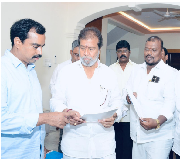
మహబూబ్ నగర్ :