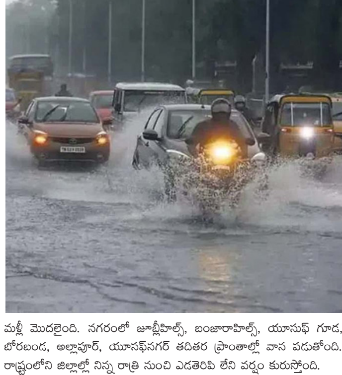
మళ్లీ మొదలైంది. నగరంలో జూబ్లీహిల్స్, బంజారాహిల్స్, యూసెస్ గూడ, బోరబండ, అల్లాపూర్, యూసెస్ నగర్ తదితర ప్రాంతాల్లో వాన పడుతోంది. రాష్ట్రంలోని జిల్లాల్లో నిన్ను రాత్రి నుంచి ఎడతెరిపి లేని వర్షం కురుస్తోంది.

మరో 4 రోజులు అతి భారీ వర్షాలు.. తెలంగాణలో మరో నాలుగు రోజులపాటు భారీ నుంచి అతి భారీ వర్షాలు వడే అవకాశం ఉందని హైదరాబాద్ వాతావరణ శాఖ ప్రకటించింది. ఇవాళ రాష్ట్రంలోని పలు జిల్లాల్లో భారీ వర్షాలు కురిసే అవకాశం తెలిపింది. రానున్న 12 గంటల్లో బంగాళాఖాతంలో వాయుగుండం బలహీనపడనున్నట్లు తెలిపింది. దీంతో రేపు నిర్మల్, నిజామాబాద్, వికారాబాద్, సంగారెడ్డి, మెదక్, కామారెడ్డి జిల్లాల్లో భారీ నుంచి అత్యంత భారీ వర్షాలు కురుస్తాయని వెల్లడించింది. ఉరుములు, మెరుపులతో పాటు 40-50Kmph వేగంతో ఈదురుగాలులు వీస్తాయని రెడ్ అలర్ట్ జారీ చేసింది. మిగతా జిల్లాల్లో తేలికపాటి నుంచి మోస్తరు వర్షాలు కురిసే అవకాశం ఉందని ఎల్లో అలర్ట్ జారీ చేసింది వాతావరణ శాఖ. మరోవైపు, హైదరాబాద్ లో వర్షం