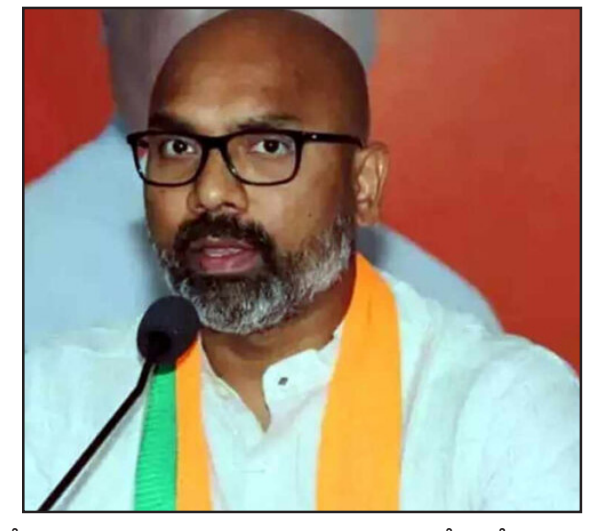
వేలకు వెళ్లకుండా ఉండాలని, ఎక్కువ ఇబ్బందులుంటే భారతీయ జనతా పార్టీ శ్రేణులు సహాయక కార్యక్రమాల్లో పాల్గొనాలని ఆయన కోరారు.

నిజామాబాద్ : జిల్లాలో గత రెండు రోజులుగా ఎడతెరపి లేకుండా కురుస్తున్న వర్షాలపై నిజామాబాద్ అండ్ జగిత్యాల జిల్లాల కలెక్టర్లకు నిజామాబాద్ పార్లమెంట్ సభ్యులు అర్జిండ్ల ద్వారా లెఖ రాశారు. లెఖల్ జిల్లాలో ఇప్పటికే పలుచోట్ల రోడ్లు తెగిపోయి రాకపోకలకు అంతరాయం కలుగుతుందని, మరో రెండు మూడు రోజుల పాటు భారీ వర్షాలు కురిసే అవకాశం ఉన్నందున, రెవెన్యూ, పంచాయతీరాజ్, మున్సిపల్ ఆర్ అండ్ బీ, పోలీస్, విద్యుత్, ఆరోగ్య శాఖల అధికారులు సమన్వయంతో పనిచేసి యుద్ధ ప్రాతి పదికన సహాయక చర్యలు చేపట్టాలని కోరారు. ఎక్కడ కూడా ప్రాణ నష్టం జరగకుండా తగు చర్యలు చేపట్టాలని కోరారు. అదేవిధంగా శ్రీరాంసాగర్ ప్రాజెక్టు ద్వారా 40కేట్లు తెరిచినందున మత్స్యకారులు, జాలర్లను అప్రమత్తం చేయాలని, నిరాశ్రయులైన లోతట్టు ప్రాంతాల ప్రజలను పునరావాస కేంద్రాలకు తరలించి, వారికి కనీస సౌకర్యాలు అందజేయాలని కోరారు. మరోవైపు ప్రజలంతా కూడా జాగ్రత్తగా ఉండాలని, అత్యవసరమైతే తప్ప బయట తిరగవద్దని ఆయన కోరారు. వ్యవసాయ మోటార్ల వద్ద రైతులు జాగ్రత్తగా ఉండాలని, గోదావరి పరివాహక గ్రామాల మత్స్యకారులు, జాలర్లు చేపల