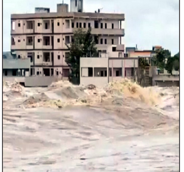
రేవంత్ రెడ్డి చెప్పారు. అలాగే సహాయకార్యల్లో నిరంతరం పనిచేసిన రెవెన్యూ, పోలీసు సిబ్బందిని ముఖ్యమంత్రి అభినందించారు. అధికారుల చర్యలతో ప్రాణనష్టం చాలావరకు తగ్గించగలిగామని పేర్కొన్నారు.

వారున్నా వదిలే ప్రసక్తి లేదని అన్నారు. ఆక్రమణకు సహకరించిన అధికారులపై చర్యలు తీసుకోవాలని సిఎం రేవంత్ ఆదేశించారు. ఖమ్మంలో ఓ మాజీ మంత్రి ఆక్రమణల వల్లే అక్కడ వరదలు వచ్చాయని, వాటిని తొలగించజేసే దమ్ము మాజీ మంత్రి హరీశ్ రావుకు ఉందా..? అని సిఎం రేవంత్ ప్రశ్నించారు. ప్రజలు వర్షాల్లో ఇబ్బందులు పడుతుంటే కెటిఆర్ ఇంగ్లండ్లో కూర్చోని టీవీల్లో చేస్తున్నారని సిఎం విమర్శించారు. వందల ఎలుకలు తిన్న పిల్లి కాశీయాత్రకు బయల్దేరినట్లు హరీశ్ రావు ఖమ్మం యాత్ర పెట్టుకున్నారని ఆయన ఆరోపించారు. పడేండ్లు అధికారంలో ఉన్న కెటిఆర్ వరదలు వచ్చినప్పుడు ఎప్పుడైనా బాధితుల వద్దకు వచ్చారా..? అని సిఎం రేవంత్ ప్రశ్నించారు. కెటిఆర్కు మానవత్వం లేదని ఆయన అన్నారు. బురదను తొలగించే పనులు వేగవంతం చేయాలి వరద తగ్గముఖం పట్టినందున బురదను తొలగించే పనులు వేగవంతం చేయాలని అధికారులకు సిఎం సూచించారు. కూలిపోయిన స్టంబాలు, ట్రాన్స్ ఫార్మర్లను పునరుద్ధరించి తక్షణమే విద్యుత్ సరఫరాకు చర్యలు తీసుకోవాలన్నారు. చనిపోయిన వారి కుటుంబాలకు రూ. 5 లక్షల చొప్పున పరిహారం చెల్లిస్తామని చెప్పారు. జాతీయ విపత్తుగా భావించి ఐదు వేల కోట్ల పరిహారం ఇవ్వాలని ఆయన కేంద్రాన్ని విజ్ఞప్తి చేశారు. మహబూబాబాద్ జిల్లాలో అధిక వర్షపాతం నమోదైనది ముఖ్యమంత్రి