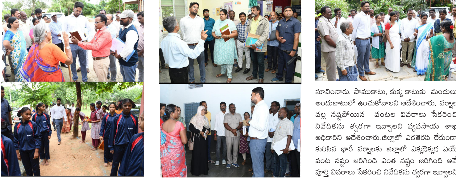
వనపర్తి సెప్టెంబర్ 3: