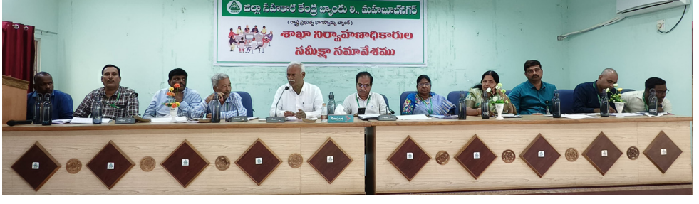
మహబూబ్ నగర్, సెప్టెంబర్ 3:

- బ్యాంకు అధికారులకు సందేశం ఇచ్చిన డిసిసిబి చైర్మన్ మామిళ్ళపల్లి విష్ణువర్ధన్ రెడ్డి